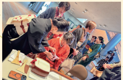
和楽器体験コーナー

のは、ひたむきに楽器と向き合うお子様の姿です。大人用の三味線は、体格の小さなお子様には扱いが難しい面も多々ありますが、難所とされる撥の扱いを見事になされる様子には、驚きと共に明るい未来への頼もしさを覚えられました。皆様楽しんで音を響かせ、笑顔で楽器に向き合われる光景は、私にとって誠に微笑ましく、心とむひとときとなりました。 こうした一期一会の機会を通じ、長唄をはじめ、箏、尺八や琵琶といった我が国の伝統芸能に、より一層関心をお寄せいただけましたならば幸いです。私自身も、その奥深い魅力を次世代へ繋ぐ一助となれますよう、今後とも一層精進して参る所存です。